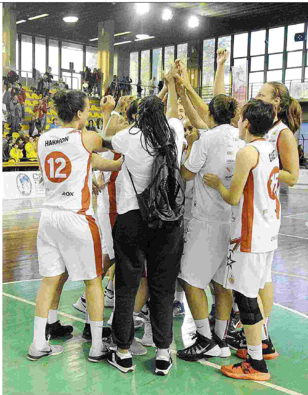
Le ragazze di Gesam si caricano a centrocampo

Incessante la carica data alle giocatrici lucchesi dai supporter arrivati al PalaTagliate. Grandissime prestazione di Harmon, infallibile al tiro