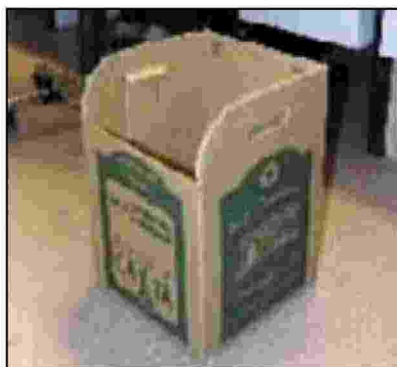
Cestino ecologico per riusare la carta