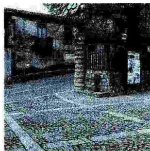
Differenziata al 62 per cento. Mongiana paese pulito

ratori comunali e del mondo della scuola, ha permesso di realizzare e poter arrivare a questo importantissimo risultato, che oltre a ingenti risparmi dei costi di conferimento in discarica dell'indifferenziato, solo 5 tonnellate nei primi 3 mesi del 2016, ha contribuito a far diventare Mongiana un paese pulito e vivibile. Ringrazio la dirigente Bruzzi per la sensibilità dimostrata e per aver dato immediata e piena disponibilità all'evento e i ragazzi che fin da subito hanno abbracciato e promosso lo stile della raccolta differenziata. Sono sicuro che con questo evento si possa entrare sempre più nell'ottica del riciclo e della corretta differenziazione dei rifiuti». ◀ (f.o.)