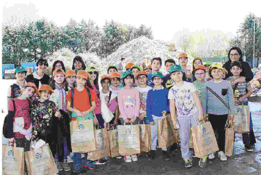
FOGGIA Il ciclo di raccolta e sistemazione in balle della carta e del cartone per il riciclaggio

«Importante la collaborazione fra pubblico e privato - ha concluso l'Amministratore de “La Puglia Recupero” - perché da tale impostazione di lavoro sinergico ne deriva la presa di coscienza dell'intera città, e nella pratica, la pulizia di un territorio e di una città realizza una nuova idea di impegno civile per la crescita culturale della popolazione».