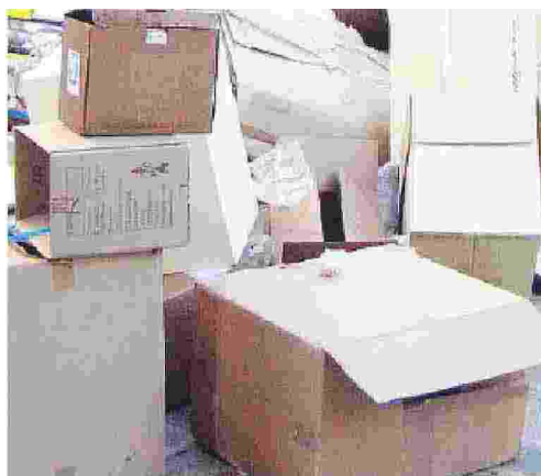
CARTONI In Basilicata incremento della raccolta