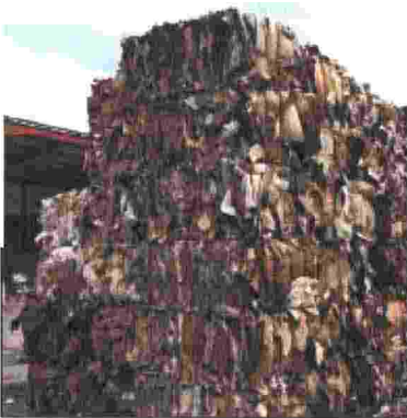
Carta pronta a essere riciclata

Sul fronte dei benefici economici, nel 2014 Comieco ha trasferito ai Comuni della Basilicata in convenzione quasi 620mila euro come corrispettivo per i servizi organizzati di raccolta differenziata comunale.