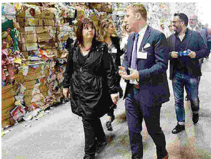
La visita della sottosegretaria Degani alla Cartiera di Villa Lagarina