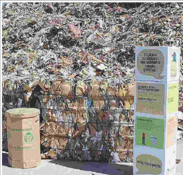
FOGGIA Alcune delle scuole che hanno fatto tappa all'impianto della Puglia recupero nell'ambito della giornata promossa dal Comieco