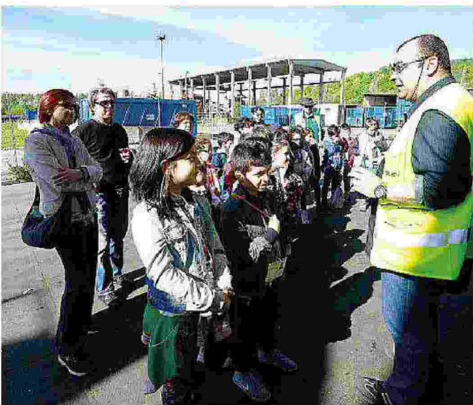
I bambini in visita al deposito di Hera dove si compatta la carta