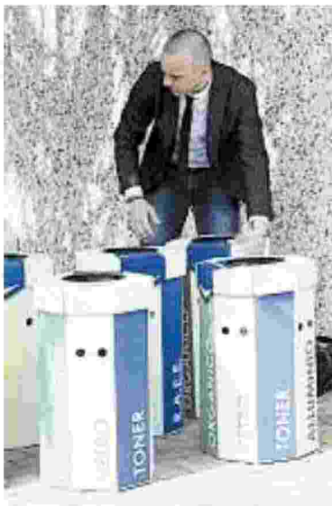
Riciclo La sfida del riciclo parte dalla Sada di Pontecagnano.