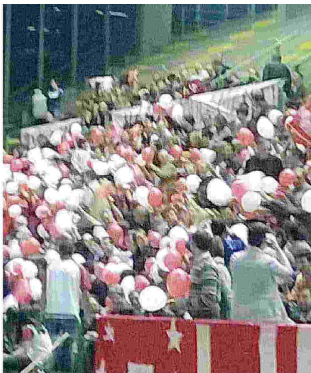
Tifosi biancorossi al palaTagliate